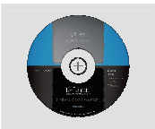
Компакт-диск с руководством пользователя и мастером установки