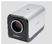
DCS-3415 18x PoE Network Camera

Если что-либо из перечисленного отсутствует, обратитесь, пожалуйста, к поставщику.