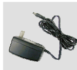
Адаптер питания 12 В