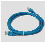
Кабель Ethernet 5 категории