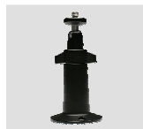
Soporte de Cámara