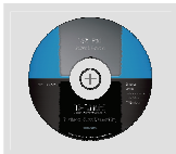
CD-ROM with Manual and Setup Wizard