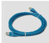
Cabo Ethernet CAT5