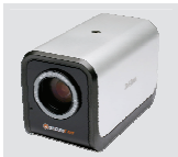
DCS-3415 18x PoE 網路 攝影機