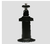
Suporte de Câmera