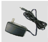
Adaptador de Alimentação de 12V