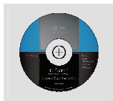
CD-ROM con Manual y Asistente de Configuración