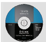
CD-ROM (マニュアル セットアップウィザード収録)