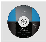
CD-ROM yang berisi Petunjuk Penggunaan dan Setup Wizard