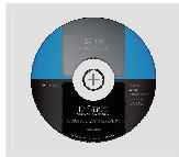
CD-ROM com Manual e Setup Wizard