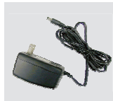
12V 直流電源 供應器